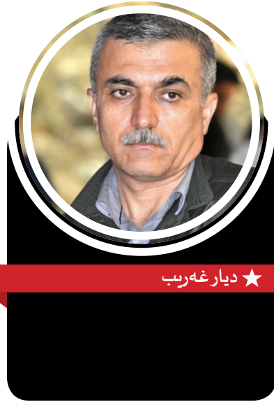
★ ديار غەيب

چەترى پارتىكدا رىكبخرىت و پارتى دەسلەلاتدار نوینەرايەتى ئىرادەى سىياسى جەماوەر دەكات. ئەم مۆدىلە بە مۆدىلى ستالىنىش بەناو دەكرىت. بەلام ئەوئەتا بۆزۆر كەس دەركەوت كە ئەم جۆرە پارتىبوونە ناتوانىت وەلامى داخوازىيەكانى گەل بداتەو.