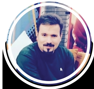
★ نۇمىد ناسىر جېمانى