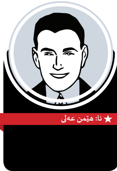
★ ئا: ھېمىن عەلى

دەوترېت. كەواتە وتووئۆز لە نېوان دوو كايەدا، «چوارچېوھە و رېساکانى زمان و ئەو دەرەفەتانەي شاراوھە لە سېستەمى زماندا» دېتە ئاراوھە. وتووئۆز لە كاتى ئىستارەوئالەت دەگرېت، لەو ساتەيەدا كە ھەلگىرى وتووئۆز لە رېگاي سېستەمى زمان و لە پەيوەندى لەگەل ھەلومەرجى عەينى دېتە كايەوھە. فۆكۆش وەك ھايدگر و بنونېست، لەو پرۆايبەدايە كە زەننەت و عەينبەت لە رېگاي پېكەتەي زمانەوھە ئافرېنەرى يەكتەرن. لەم پېناوھەدا، فۆكۆ لە ژېر كاريگەرى ھايدگر و بنونېست، مادى بوونى زمان لە چوارچېوھەي وتووئۆزدا ئەرئ دەكات و بەم شېوھە، بېر كەرنەوھە نە وەك ديار دەيەكى زەنى يان كايەيەكى بېندتر لە ئاستى نر خدا، بەلكو وەك ديار دەيەكى وتووئۆزى و مېژووي دەژمېردرېت. ئەو بە كەلك وەرگرتن لە چەمكى «سېستەمە فېكرىيەكان» و ناسينى، وتووئۆز بوونى بېر كەرنەوھە تاوتوئ دەكات. سېستەمە فېكرىيەكان، رېساگەلېكى ئاناگان كە لە رېگەي ئەوانەوھە وشەكان، شتەكان و كەردەوھەكان لە يەكتەردا تېكەل دەبن. واتە وتووئۆزەكان لە