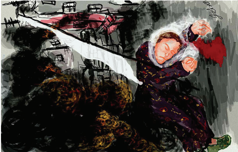
وېنەبەكى تر لە كارە ھونەرىيەكانى زەھرا دۇغان

ئەو تابلۆى تايبەت ئىنان، دايكى يانزە منداى، كىشا، ئەو ژنەى كە لەلايەن ھېزە ئەمنىە قەناس بەدەستەكانەو دەپيكرىت و لە ناوہ پراستی شەقام دەمپنئەو دەمرىت. خانەوادەكەى ھەولەدەن بەھاناپەو ەچن، بەلام لەلايەن بەرپرسە ئەمنىەكانەو رىگەيان لئیدەگىرئت. لە تەمەنى ۵۷ سالىدا، تايبەت ئىنان بەم تراژىدىايە گيان لە دەست دەدات و تەرمەكەيشى بۇ ماوہى خەفت رۇژ لەسەر شەقامەكەدا دەكەوئت.