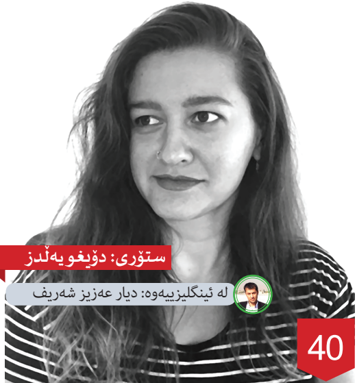
ستۆرى: دۆيغويه ئىلز