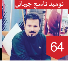
نوميد ناسح جيهانى