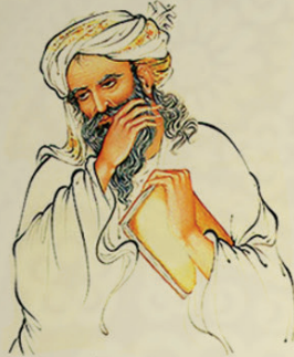
سۈھرە وەردى (شىخى ئىشراق)

ناۋى تەۋاۋى (شىخ شەھابەدىن يەھىيا ابن ھەبەش) بەپىي بۆچۈنى ئىبن خەلەكان، لەپەرتوكى وفیات الاعیان-دا، لەنىۋان سائى (۱۱۵۰-۱۱۵۵) لەناۋچەى سۈھرە وەردى ناۋچەى (گەروس) ى بىجار لە رۇژھەلاتى كوردستان لەدايك بوۋە. بەپىي وتەيى يە ك لەخوتىندكارەكانى بەناۋى شەمسەدىنى شاره زورى لەسائى ۱۱۸۶ زكۆچى دوايى كردوھ