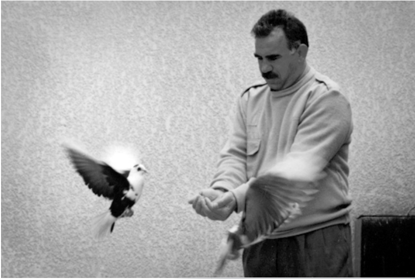
ئۇچلان كاتىك خواردن بە كۆتۈر دەدات

پېشىتر لە ئەنقەرە بەسەرم برد رۇڭى لەوھدا بىنى بەخېرايى بەرەو پېشەوھە برۆم. وەك لايەنگرىكى سروسىتى بەرەي پارتى كۆمۇنىستى گەلى توركىيا THKP-C جموجۆلم دەکرد. لەزانكۆو كۆلېژى زانستە سىياسىيەكاك زال بون. ماوھەيەكى درېژ چاوپروانى THKP-C راستەقىنەكانم كرد. كاتىك قەلەمبازە چاوپروانكراوھكانم نەبىنى، ئىتر ھېدى ھېدى لەسەر رېبازى خۆم قالدەبوومەوھ. ھەنگاۋەكانم بۇ ئامادەكارى سەبارەت بەكىشەي نەتەوھىي كورد دەست پېكردبوو. بەھۇى ھەئۆستە شۆقېنپەكانپانەوھ بەرپۆھچوون لەگەل چەپى تورك ئاستەم دەبوو.