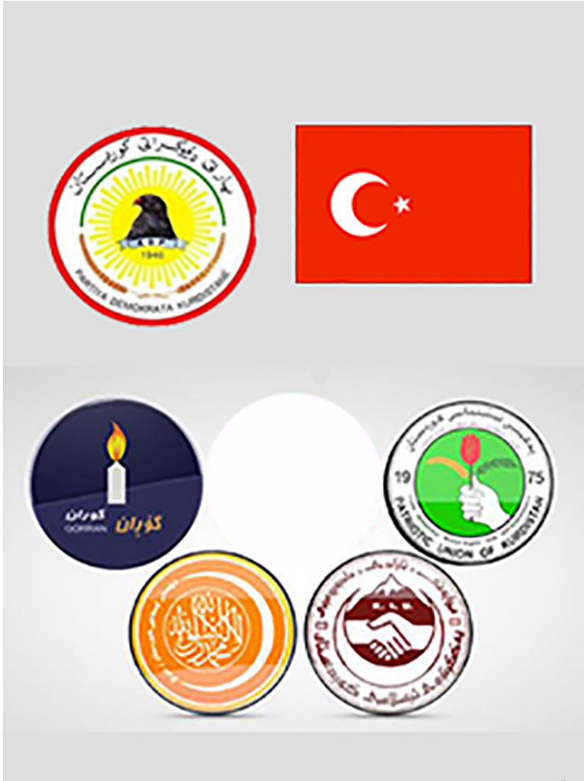
ئالدى لايەنە سىياسىيەكانى ھەرىئى كوردستان

بېگومان لېردا توركىيا و پارتى يەك ئەجىندا يان ھەيە، ئەوئش لاواز كوردنى پارتى كرئكارانى كوردستانە.