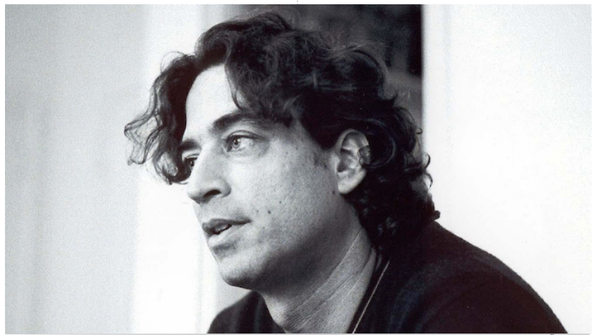
مايكل ھارت (Michael Hardt)، فەيلەسوفىكى سىياسىي ۋە تىۋرسىي ئەدەبىيە

ھەر لە سەرەتاۋە سۆسەي ئەۋەمان كىرد وىلايەتە يەكگرتۈۋەكان ھەر بەم زوۋانە ناتوانىت كاروبارى جىمان بەرپۈۋەبەرىت، واتە ناتوانىت ئەم كارە بە تەنيا و تاكلايەنە ئەنجام بدات، بەلام لەۋ كاتەدا بىرمان لەۋە نەدەكردەۋە كە دەۋلە-نەتەۋەبەكى دىكەي ۋەكو چىن ئەۋ پىنگەيە داگىر دەكات، يان تەنەنەت دەتوانىت ھاۋپەيمانىيە چەندلايەنە (multilateral alliance) لەنىۋان دەۋلەت-نەتەۋە بالادەستەكاندا بۇ كۆنتىرۆلكردىن كاروبارى جىمان، دروست دەكات. گرمانەكەي ئىمە ئەۋەبوو كە تۈپكى بەھىز لە سەرۋەختى پەيداۋوندايە ۋە خەرىكە گەشە دەكات، ئەۋەپىش دەۋلەت-نەتەۋە بالادەستەكان دەگرىتەۋە بە پال دامەزراۋە سەرۋە-نىشتمانىيەكان (supranational institutions) ۋەكو كۆمپانىكان ۋە رىكخراۋە نا-ھكۈمىيەكان (NGOs) ۋە لاينە چالاکە نا-دەۋلەتتەيەكان (non-state) دىكە، بۇ ئەۋەي بەشۈۋەبەكى دەستاۋدەست ۋە بەرپىكەۋتن كۆنتىرۆل پەيوەندىيە نىۋەدەۋلەتتەيەكان بكنەن.