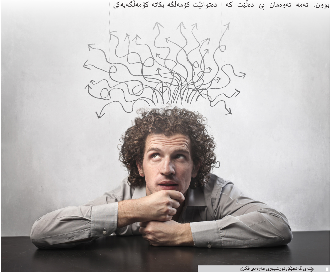
ويئەى گەنجىكى تووشبووى ھەرەسى فکرى

ئەم دەسلەتەوہ بە سەدان ھەزار گەنج لەم ولات و دەسلەتە رايان کردووہ بۆ ولاتانى رۆژئاوا و ھەزاران گەنج لە ريگەى قاچاخدا لە ئاوەکاندا خنکاون و ھەزارانى تر بئ سەر و شوپن بوون، بە پي چەندين ئامار و داتا کہ لەلایەن فيدراسيوني سەرانسەرى پەنابەرانى عيراق تۆمار کراوہ، تەنھا لە دوو سالى رابردودا (۲۰۱۶-۲۰۱۷) نزىکەى ۵۰ ھەزار گەنج ھەريى کوردستانيان بەجپيشتووہ و زياتر لە ۳ ھەزار گەنج لە ئاوەکانى ئىجە و دەرياي (سپى) ناوہراست خنکاون و بە ھەزارانى تر بئ سەر وشوپن بوون، ئەمە ئەوہمان بئ دەلپت کہ