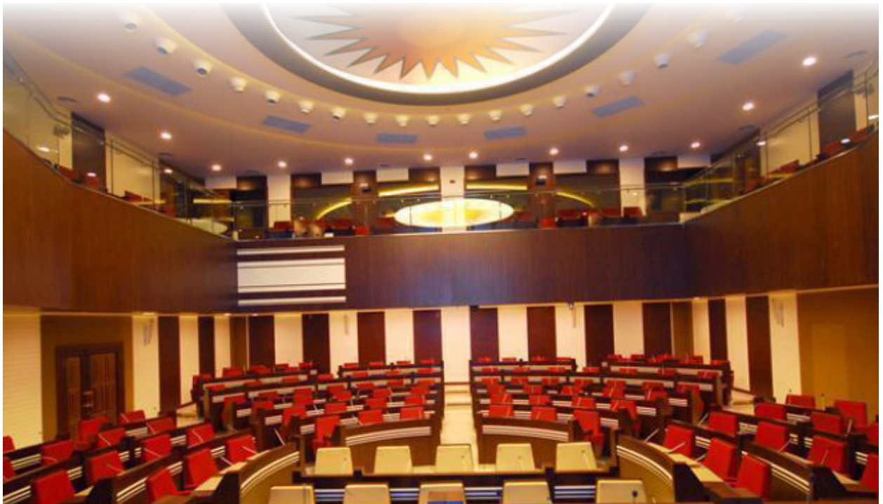
ۋىنەى چۆلبوۋنى پەرلەمان بەردەۋامە