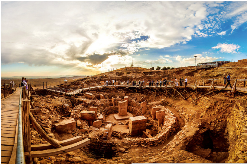
وینەى شوپىنە وارى خرابە رەش

دیزە دەبەخشىت»، ئەو شوپىنە واره، شتانەى دۆزىويانە تەو، بەو ئەنجامە مېژوو دەكەى بۆ يازدە ھەزار سال پېش گەيشتون كە بۆ يەكەمېن جار لەو ئىستا دەگەپتەو، ئەو گردو بەرزايىيە پەرسىتگايانە رېپورەسمە ئايىنەكان پېرۆزە چەندىن شوپىن «تەلار»ى ژمارەيەكى زۆرو قەرەبالغى مرۇقى