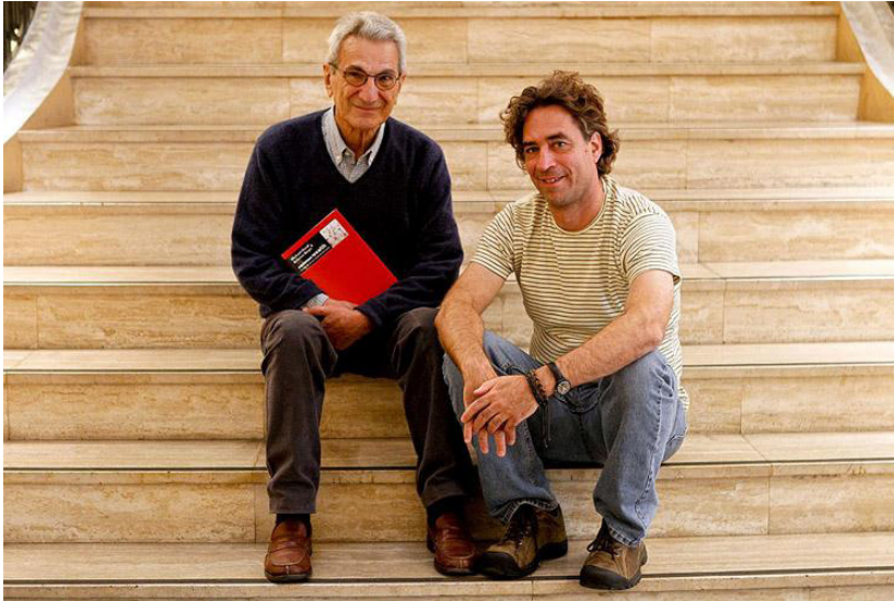
لە راستەو مایکل هارت و ئانتونىۆ نىگرى

بۇ ھاوبەشبوون، بۇ نموونە، فۆرمە نا-ماتىرىيالىيەكانى سامانە (immaterial forms of wealth)، وەكو مەعرىفە زانستىيەكان و زانىيارىيەكان و بەرھەمە كلتورىيەكان و كۆد و شتى لەم بابەتە. بواریكى دىكەى گىرنگى داواكارىي، پەيوەندىدارە بە زەوى و سىستەمە ئىكۆلۆژىيەكەيەو، ئەم لایەنە تەنیا دەشت بەشپۆەيەكى دىموكراسى چارەسەرى كارلېكە ھاوبەشەكانمان لەگەل دەوروبەردا بكات. دواچار، بواریكى دىكە، پىموايە بزووتنەو كۆمەلایەتییەكانى ئەم دوايىەن كە مانگرتنە شارنشىيەكان (urban encampments) و پرۆسەكانى داگىرکردنى سەرا گشتىيەكانى گرتەو، ھەر لە گۆرەپانى تەحریرەو تە دەگات بە پاركى گازى «لەتورکیا» و پپورتا دىل سۆل (Puerta del sol) و پاركى زۆكۆتى (Zuccotti Park)، (بەشپۆەيەكى رېژەي) ئامانجە سەرەكییەكەپان ئەوہوو شار بکەنە شتىكى ھاوبەش.