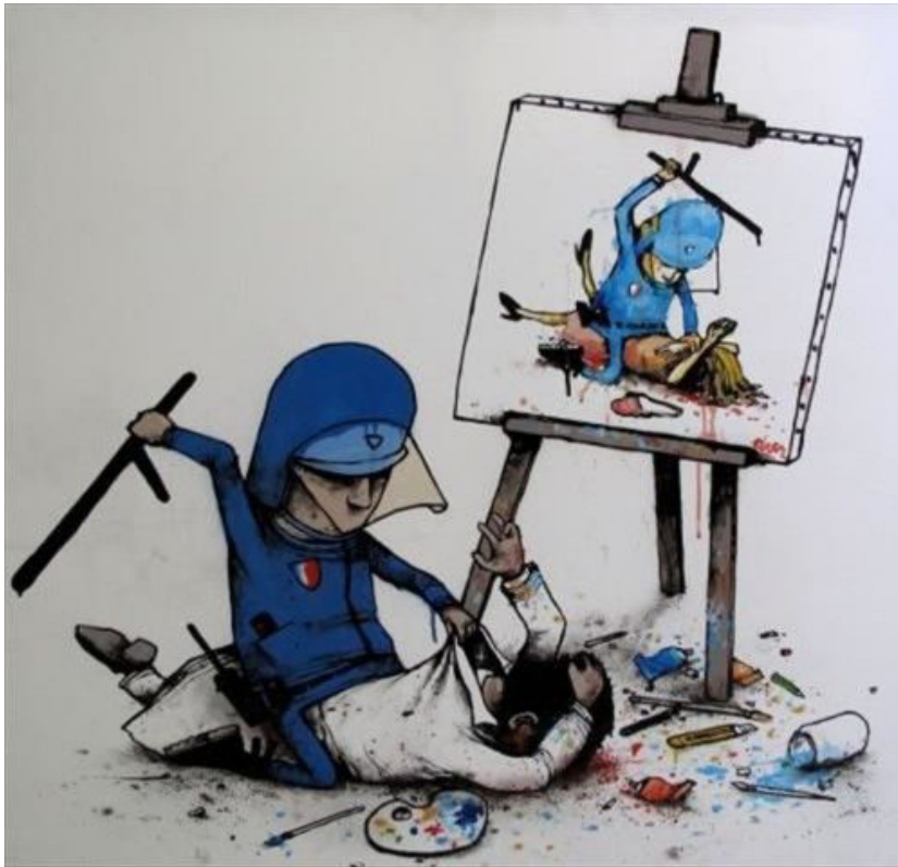
ۋېنە يەنى كارىكاتۈرى ھېما بۇ ئازادى رادەربېن دەگا

سەرکەوتو ناپېت. ناکرېت دوو دەزگای ئاسايشى نەتەۋەپى ھەبېت بۇ يەك نەتەۋە كە يەك سەرۋكى ھەرىپى ھەيە. يەك پەرلەمان و يەك حكومەت. ئەم دياردەپە بۇشايى دروست دەكات لەنيوان كۆمەل و ئاسايشە نەتەۋەپپەكەيدا، دەزگايەكى ئاسايش كە متمانەى خەلكى بباتەۋە. ئايا ھاۋلاتى زانبارى بە كام دەزگا بدات سەبارەت بە ئاسايشى كۆمەل، چ ھاۋلاتىكە دەپارېزېت ئەگەر لە پېناۋى ئاسايشى نەتەۋەكەيدا ھاۋكارى دەزگای ھەۋالگىرى يان ئاسايشە نەتەۋەپپەكە بكات بۇ نمونە بەرامبەر بەھەرپەشەى تېرۇر. بى ئەم ھەنگاۋە باس كردن لە سىستەمىكى ئاسايشى نەتەۋەپى ھەرىپى كوردستان كارىكى گرانە.