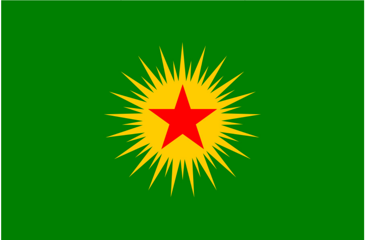
ئالاي كۆنقىدرالىزىمى دىموكراتى

بە ھەلكردى ئالاي كۆنقىدرالىزىمى دىموكراتىك نىشان دەدا. بەلام رىز لە ئالاي ئەو پارتە سىياسىيانەش دەگرى كە لە زىر زەنىەتى دەسەلاتخوۋى و دەولەتگەرايانە دا ئالاي دەولەتگەرايى ھەلدەدەن. لە ھەمانكات دا چاۋەرۋانى ئەۋەى ھەيە كە رىز لە ھەلكردى ئالاي كۆنقىدرالىزىمى دىموكراتىك بگېردى. ھەلوئىستى پەكەكە لەم مژارەدا ئاۋەھايە. ھەندى كورد لە نىيەتتىكى پاكەۋە پرسىارى ئەۋە دەكەن كە بۇچى پەكەكە ئەۋ ئالايە لە باشۋورى كوردستان ھەلكرەۋە ھەلناكات يان ئالاي دىكەى بۇ خۇى دەسنىشان كوردۋە و ھەئىان دەدا. ۋەلامى ئەۋ پرسىارەمان بە ۋوونى و بەرفراوانى لە سەرەۋە داۋەتەۋە.