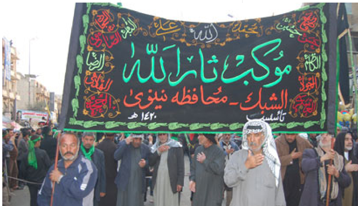
کوردانى شەبەکا لە مەراسیمىکى تايبەت بە خۇيان