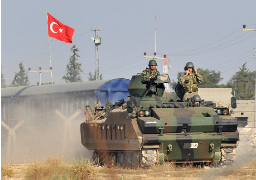
ۆتەنى يەككەك لە بىنكە سەربازىيەكانى توركىيا لە ھەرىي كوردستان

ئازادىي كۆمەلگە: ھۆكارى پېداگىرى كردنى توركىيا بۆ داگىر كردنى باشوورى كوردستان چىيە؟ د.فايەق: ئەو سىياسەتەى ئىستاي ئەكەپە پەپرەوى دەكات دەيەوئىت سىياسەتى دەولەتى ئىمپىراتورىيەتى عوسمانى زىندوبكاتەو، ئىستا ھەولئەدات سورييا داگىر بكات، باشوورى كوردستان داگىر بكات و ھەولئەدات ھىچ مافىك نەدات بە گەلى كورد لە باكورى كوردستان، ئىستاش دەيەوئىت ئەووى لە رابردوودا وھك قوبرس داگىرى كرد بەھەمان شۆپە لە ھەولئە برفراوانكردنى خاكى توركىيايەتى، ئەگەر سىياسەتى عىراق نەبوايە لە رزگار كردنى موسل توركىيا بەشدارى بكردايە ئەو ھىزى خۇى زىاتر لە ناوچەكەدا جىگىر دەگرد، بەدئىيايەو دەبوو داگىركارى عىراقىش، نەك بەتەنھا كوردستان، يانى ئەكەپە سىياسەتتىكى ئىستىعمارى نوئى ھەيە و دەيەوئىت لە ھەموو روويكەو