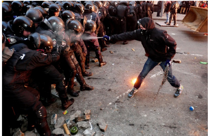
وئەي گەنجىكى خۆبىشاندەر

ئازادىخواز بەم چەشەنە بەردەوام بىت تا ساى ۲۰۱۸ دا رىژەى بىكارى گەنجان لە باشوورى كوردستاندا بگاتە نىكەى ۴۰٪ كە ئەمەش دەكاتە نىكەى نىوەى كۆمەلگەى باشوورى كوردستان، ئەمە جگە لەوەى سالانە بە دەيان ھەزار گەنج زانكۆ تەواو دەكات و چاوەرپى دامەزراندنە، بەلام لەم ژمارەيەدا تەنھا ئەوانە دادەمزرىن كە دەستى حىزبىيان لە پشەتەوويە و بە واسىتە داياندەمەزرىن و بەشە زۆرەكەش ھەر لە چاوەرپى دامەزراندن چ لە كەرتى تايبەت چ لە كەرتى گشتى بىت، بۆيە لە ئىستادا خويندكاران بە لىشاو زانكۆ و پەيمانگاكان چ دەھيلىن و روو لە كار و كەسابەت دەكەن يان دەچنە دەرەوويە و لات لەبەر ئەوويە ھىچ ھىوايەكيان بە خويندن نىيە و نايانەويت لە چاوەروانىدا تەمەن بەفەرۆ بەدن، بە دلىنايەووە بۆ ئەوويە چۆنيان دەويت ئاوا بۆيان ھەلسورپىت، كە ئەمەش ھۆكارى سەرەكەيە بۆ لە ناوچوونى سىماى شارستانىيەتى ھەر كۆمەلگەيەك. لە باشووردا ھەر لە سەرەتاووە رۆلى گەنج بەبنەما نەگىراووە و تەنھا بۆ (مەرامى سىياسى و تايبەتى و شەخسى...ھتد) بەكارھىنراووە، كە ئەمەش بىگومان دەگەرپتەووە بۆ ئەم پاشخانە فيكرى و سىياسى و فيوداليەى، كە دەسەلاتى باشوور بەرپۆدەدەبات، ھەر بۆيەشە ئەم جۆرە سىياسەتە نەرسىتۆكرامى و تۆتاليتارىيە، بۆتە مايەى بى ئىرادەكردن و بى ھىوا كەردنى گەنج و زەوتكردنى ئازادىيەكانى لە چوارچىوويە كۆمەلگەدا، لە ماوويە ئەم چارەگە سەدەيەى كە باشوورى كوردستان كەوتۆتە دەستى