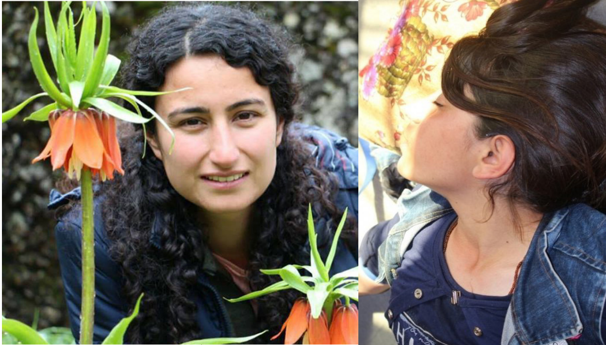
نازى نايىف و نوزيان نەرهان تېرۇرى دەستى سىتەم و زۇردارى

بۇ پەكەكە بابە تېكى ئەخلاقى، نىشتىمانى و نەتەبىيە و ئەمەش ھەم بارزانى و ھەمىش تورىكا ئى ئاگادارن. لەو ھەش ئاگادارن كە ئېزىدە كان ھەموو ھىوايە كىيان بەپەكەكە يە، ئەگەر لەشەنگال پەكەكە بشكىن ئەوا ھەم ئاواتى ئېزىدە كان دەرۇخىن و ھەمىش دەتوانن لەو پەكەكە چەتە كانىيان لەگەل داغشدا ئاودىوى رۇژئاوا بىكەن و دەسكەوتە كانى رۇژئاواى كوردستانىش بخەنە مەترسىيە ھە.