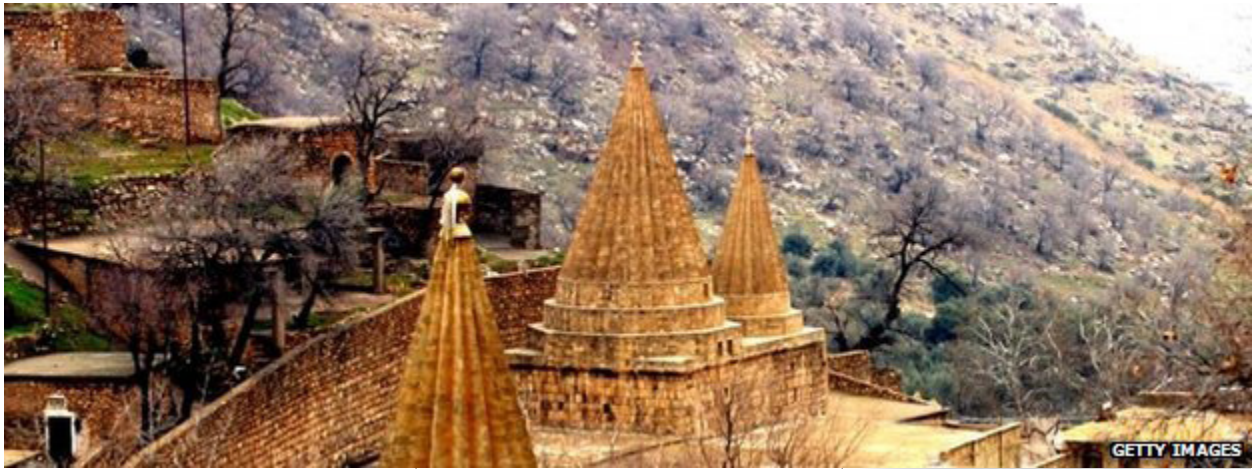
وئىنەي پەرسىتگايەكى ئىژىدەيەكان

خەلكى شەنگال، كە ژمارەيان ۲۱ كەس و پىك ھاتوھ لە ژن و پياو و گەنج و چىن و توژى جياجياكان، لەسەر ئەو بنەمايە ئەو ئەنجومەنە چەندىن كۆمىتەي بۇ خزمەت كەردن دروست كەردوھ، كۆمىتەي پەروەردە كە ئەركى پەروەردە كەردنى مندالانى شەنگال و نەھىشتنى نەخوئىندەوارىيە لەناو خەلكى شەنگال، بەھەمانشىوھ كۆمىتەي خزمەتگوزارى و پاكردەنەوھ ھەيە، ھەروھە كۆمىتەي چارەسەر كەردنى كىشەكانى كۆمەلگە و دادى كۆمەلەيەتى ھەيە، ھەمانكات كۆمىتەي تەندروستى و ژىنگە پارىزى و كەردنەوھى چەند بىكەيەكى تەندروستى. ئەمەش بۆتە ھۆكار كە خەلكى شەنگال پىئوستىيان بە دامودەزگاكانى مەنفاي پارتى نەماوھ، لەلەيەك ئەوانەي پ د ك/ع بەناوى قائىمقام و بەرپرسى ئىدارى داياناون ئەوكەسانە لە ۲۰۱۴/۸/۳ لەگەل ھىزەكانى پ د ك/ع رايانكرد و خەلكى ئىژىدىيان خستە دەست چەتەكانى داعش، بۆيە خەلكى شەنگال ناتوانن ئەو جۆرە كەسانە وەك بەرپرسى ئىدارى خۆيان قبول بكەنەوھ. لەلەيەنى سىياسىيەو جفاكەيەوھ: وەكوتەر