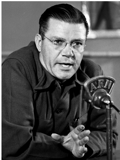
رۇبېرت مكنمارا وھزىرى بەرگىرى پېشوى ئەمريكا

ئاشقى لە ئاسايشدا. لە ئەنجامى گۆرانكارپەكان لە ھەپكەلى سىستەمى سىياسى نپودەولتەتى لە فراوانبوونى بۆ دەولتەتان و رېكخراوھ نپودەولتەتپەكان، ھەرورھا فراوانبوونى بەرژوھەندپە سىياسى و ئابورى و سەربازى دەولتەتەكان و پېشكەوتنى زانست و تەكنەلۇژيا لە گشت بوارەكانى ژيان چپتر بەتەنپا ھىزى سەربازى دەولتەت كارپگەر نەبوو، بەلكو جگە لەوھ تواناى ئابورى و سىياسىش رۆلى كارپگەرى بېنپوھ. فاكتەرە سەرەكپەكانى پىشت ئەم ئارپاستەپە دەرئەنجامى جەنگى دووھى جەپانى و پېشكەوتنە