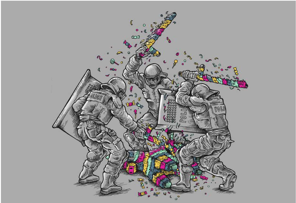
ۋىنەي كارى كاتىرى ئاسايش!