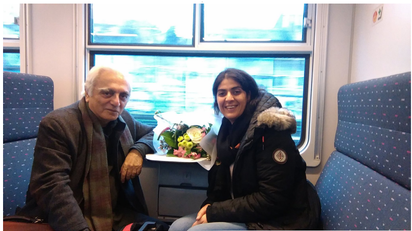
ویلایه تی « فراه »؟

یای سیله ی غه ففار: به ئن، هاو سنوره له گه ل ئیران. زور جار زور شیوه له و جینایه ت و خیانه تانه ی که له گه ل