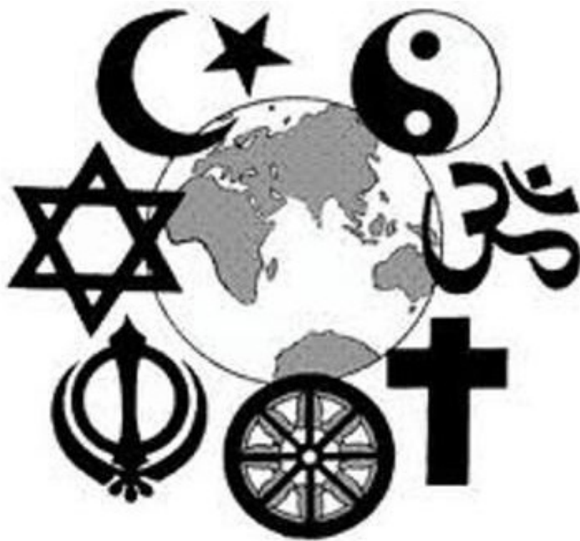
بەشېككە لە ئاينەكان

مرۇفايەتى دەکرد. ئەگەر بۇ دەقە يەكشەنبە كېشەكان بېت ئەم جېھانە چارەسەرى كېشەكان بىداتە دەست ژنان دىنىيەم لە ھەم بە ئازادىيەت، پەيۋەندى ئاينە بە كۆمەلگە ھەم زۆر بە باشى يەكلادەكە يەنە ھەم چارەسەرى دەكەين. ھەم كېشەكانى تر لە دىنى ئاينەگەرىتى، نەتە ھەم بەرستى، رەگەزگەرىتى و زانستگەرىتى تېكۆشان دەكەين، لە بەرئەھەم بە ئازادى ژن ئازادى ھەم كۆمەلگە و جېھانىشە. رۆژدا يىلدرم : نوسەر و كۆمەلناس. لەسەر كاروبارى سىياسى ماۋەى ۱۰ سال لە لايەن دەولتە تى تورك دا زىندانى كرا و ئىستاش چالاكفانىكى ژنە و درېژە بە كاروخەبات دەدات لە نيو بزوتتەھەم بە ژنى كورد-ئەوروپا. چەندىن لېكۆلېنەھەم بە لە بوارى ئاينە و باۋەرىەكان دا ھەيە