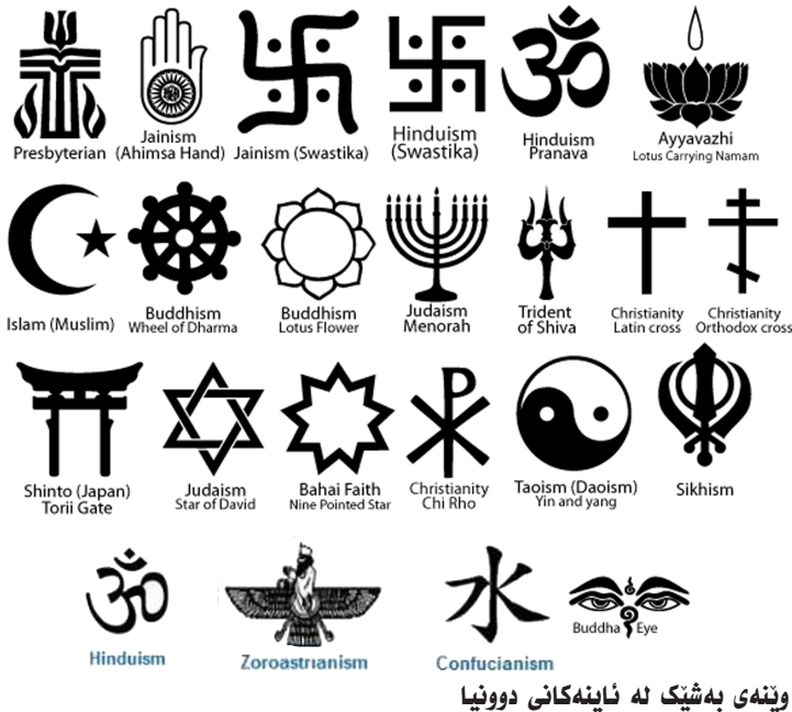
وینهی به شیک له ناینهکانی دوونیا

ناساندنی خهبات و هزری ریهری کورد عهبدو لئا ئوجالان، کاری پرۆزه یهکی درێژخایه ن و ستراتیژی و دهسته جهمعی و کۆمه لیک نیوهندی ئەکادیمی و کهلتورییه و ئەم کۆنفرانسه ی ئەکادیمیای سیاسهت و هزری دیموکراسی که ناشتی و سهقامگیری رۆژه لاتنی ناوینی له هزری ئوجه لاندنا کردوو ه به بابهت، ده شیت ههنگاوێکی گرنگ بیت له راستای ئەو پرۆزه یه دا. گرنگی ئەو پرۆزه یه له راستیدا گرنگیه کی شارستانی ههمله لایه نه و ده شیت بیرکردنه وه راسته قینه له گۆران و ئومید بو ئەم ناوچه یه به ئینت.