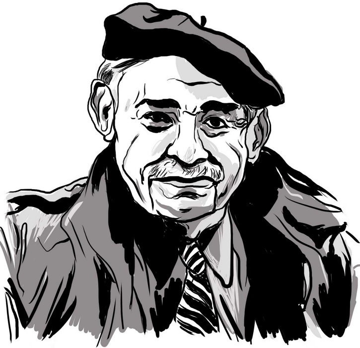
وینەي موری بووکچین

زیندان دا ساز بی. و تيمە زۆرمان پت سەیر بوو، واقمان و پرم.