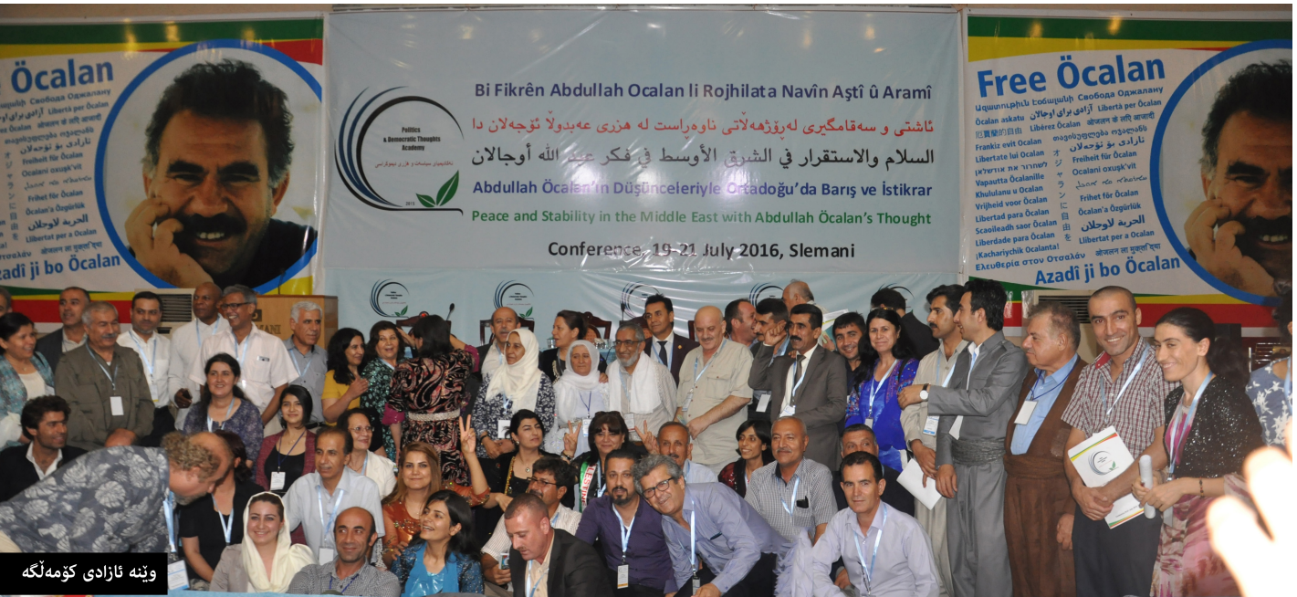
وئە ئازادى كۆمەنگە

روژئاواى كوردستان ئەنجامدانى كۆنفرانسى سالى داھاتووى 'ھزرى ئوچالانى' خستە ئەستۆى خۆى