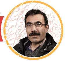
ئالدار خەلېل لەعەرەبىيەۋە: دلېر ئاكرەبى