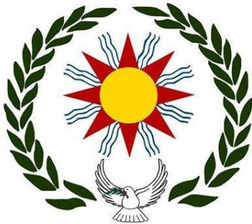
بەرەى ديموکراسى گەل كوردستانى ديموکراسى گەل ۲۰۱۶